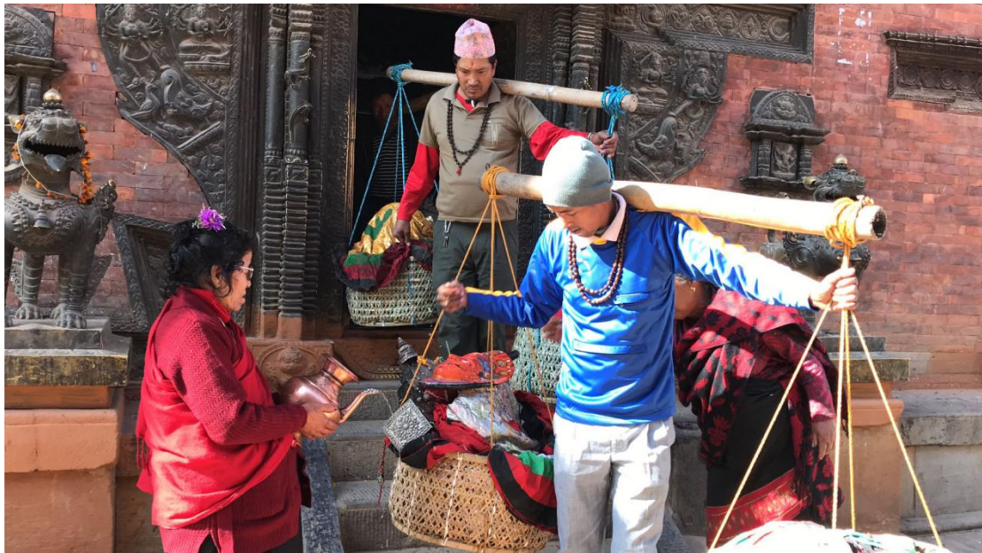
Figura 2. Il 16 dicembre 2018, la Nakim dà la benedizione ai danzatori alla partenza per Pashupathi (KTM).

La presenza di Nakim è limitata geograficamente a Bhaktapur, ma la sua partecipazione alle cerimonie, in particolare nel caso dei dhe bokegu (letteralmente significa accontentare le divinità, sono costituite dalle pūjā offerte dai privati), non è totale. Ad esempio, il 13 dicembre 2018 una famiglia della zona di Barwa Chowk ha offerto una pūjā alle Nava Durgā come buon auspicio durante i festeggiamenti del matrimonio del figlio. La Nakim ha potuto partecipare alla pūjā come tutti i membri maschi della comunità, ma quando la famiglia ha invitato i membri a cenare a casa, la Nakim ha dovuto aspettare fuori che gli altri finissero di cenare per poi continuare la danza.