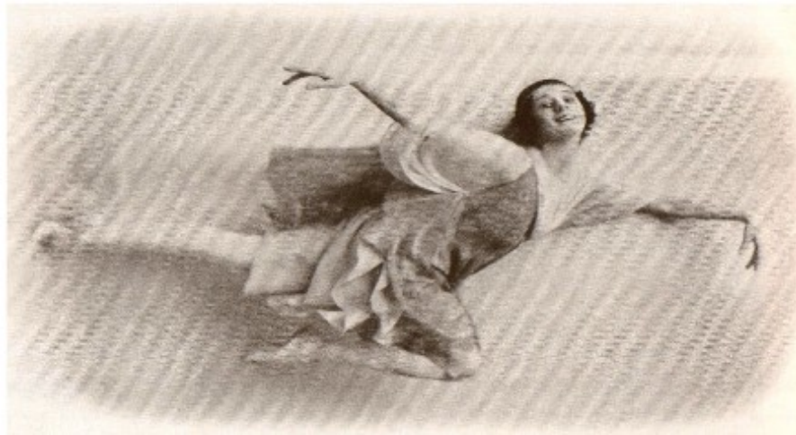
1. Anna Pavlova in Orpheus . La figura è qui ruotata di 90° in senso orario, come fece Bakst per la locandina del 1916.

realisticamente danzante, Fenella alle origini del cinema americano, The Dumb Girl of Portici (1916) 14 : “Pavlova The Incomparable”. L’emblema sarebbe potuto essere proprio questo, a commento dell’eterea danzatrice vestita alla greca in volo al centro del programma – come lo aveva pensato Bakst nella locandina del 1916 per la Belle in tournée americana (fig. 1).