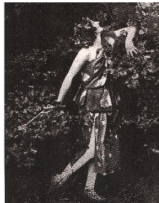
8. Anna Pavlova à la grecque nel giardino di Ivy House.

Hyden chiude senza precisare il contributo della russa all’arte dell’americana, ma la frequentazione delle due donne, che dal 1904 continuarono a incrociarsi e incontrarsi tra Europa e Stati Uniti, va al di là della polarità delle loro manifestazioni (furore divistico, da una parte, rinascita ellenica dall’altra).