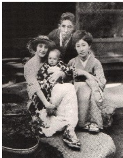
3. Pavlova col maestro Kikugoro VI, sua moglie e il figlio più piccolo (1922).