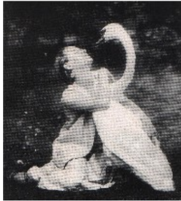
4. Pavlova con Jack nel parco di Ivy House.

L'interpretazione del celebre assolo, trasumanato di lì a poco in un'icona dell'arte sua e di questa rimasto unico superstite insieme a Les sylphides , era per Pavlova molto più di una semplice danza – basti pensare al rapporto, per così dire, carnale che era riuscita a conquistare coi cigni di Ivy House, ai quali si stringe in sensuali abbracci che ricordano la mitica copula di Leda con Zeus in forma anatide (figg. 34). L'aura mitica di cui è circondato non lascia molto spazio alla sua profanazione essendo diventato da una parte un oggetto di culto, in virtù della celebre pellicola che lo registra in una interpretazione matura, dall'altro il banco di prova e la consacrazione di ogni grande ballerina 38 . Diverse anche le versioni sulla sua genesi: Fokine non l'avrebbe pensato per Pavlova, scrive Levinson (1990: 54), ma per un'altra, imprecisata danzatrice che lo rifiutò con disprezzo. Tuttavia il noto critico parla di Pavlova come della vera creatrice del solo e in questo senso anche il più (auto)accreditato Dandré ne precisa l'apporto decisivo ricordandone l'impulso originario: La morte del cigno "era il lavoro di un momento di ispirazione [...]. L'idea venne in mente a Pavlova e in circa un'ora Fokine lo compose" (Dandré 1932:32) 39 . L'idea, dunque, la prima impressione avevano